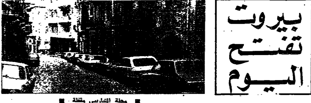
محلة التبراسي مقفلة

اتضح الاهتمام الرسمي والسياسي طوال يوم امس ببذل مزيد من الجهود لتطبيق ليل ومضاعفات حدث الانفجار المروع في طرقة الكعكي و اسفرت هذه الاتصالات المكثفة عن توافق جهازي في الرأي على ضرورة مواجهة خطط التاجر على مسيرة السلام بوعسى وموسوعية ، شين وسائل قانونية تتسع في المجال أمام قوات الإسراع العريضة والجهود الخاصة لكشف النقيب عن الجهات التي تقف وراء مخطط القتل . وقد تم التوصل الى هذه الماتعة عبر اتصالات شارك فيها الرئيس سركيس ورئيس الحكومة والشهيد الجليل وازكار الجبهة اللبنانية وتيادة قوات الردع وقيادة القوات اللبنانية ، بالإضافة الى مشاركة العرع الطريري والجلس الإسلامي الشيعي الأعلى .